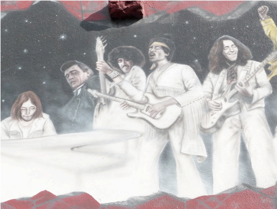
Stars above ...

Riverboat – World Music Network – Store | Browse Labels